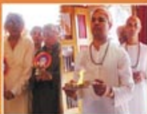
श्री प्राणनाथ प्राकट्य महोत्सवमें की गई प्राकट्यकी महाआरती