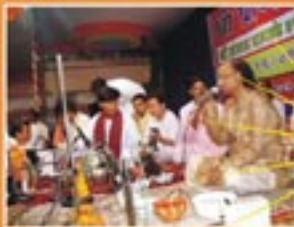
रात्रिकालीन सांस्कृतिक कार्यक्रमकी झलक