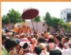
श्री प्राणनाथजीकी छद्मी महोत्सवकी झांकी