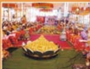
महोत्सवान्तर्गत आयोजित ३१३ राजभोग दर्शन