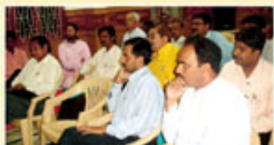
श्री ५ नवतनपुरी धाममें आयोजित पत्रकार संमेलनके दृश्य