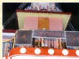
श्री कृष्ण प्रणामी मन्दिर, उपलेटा ( राजकोट ) में आयोजित पूजा पधरावनी, कलश अनावरण एवं सत्संगके दृश्य