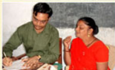
श्री ५ नवतनपुरी धाम द्वारा हरिपुर गाँवमें आयोजित नेत्र निदान यज्ञके दृश्य